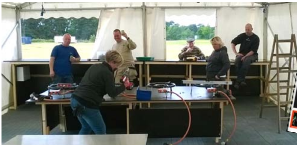
Inventaret gøres klar i den spanske madbod i Apollo-området. Som det ses, i en afslappet stemning.